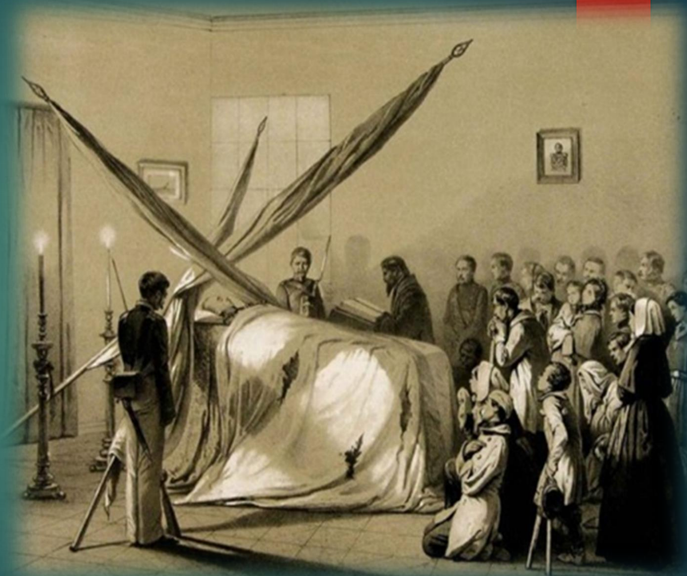
Похороны П.С. Нахимова. Н. Берг

12 июля 1855 года Нахимов был смертельно ранен на Малаховом кургане в Севастополе.