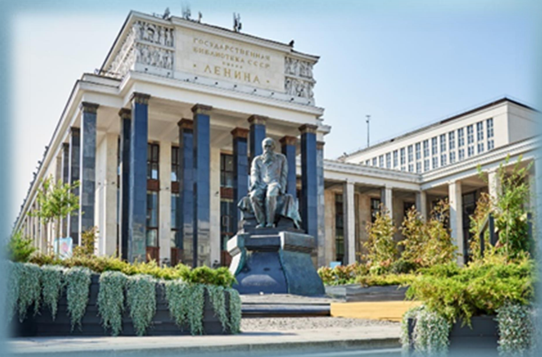
Российская государственная библиотека