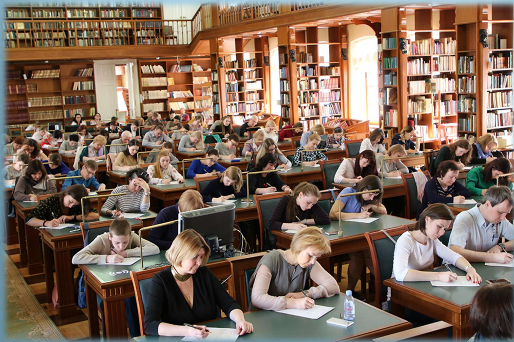
Румянцевский зал принимает участников образовательной акции «Тотальный диктант»