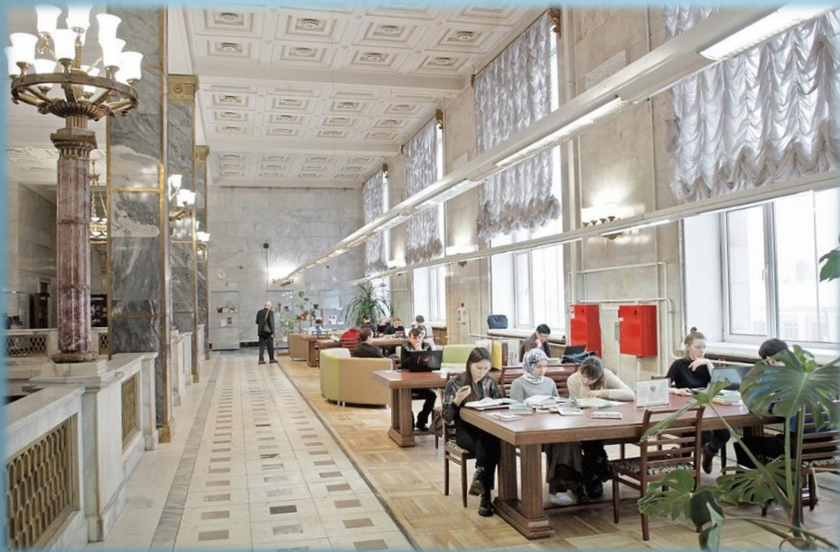
Зона текущих периодических изданий