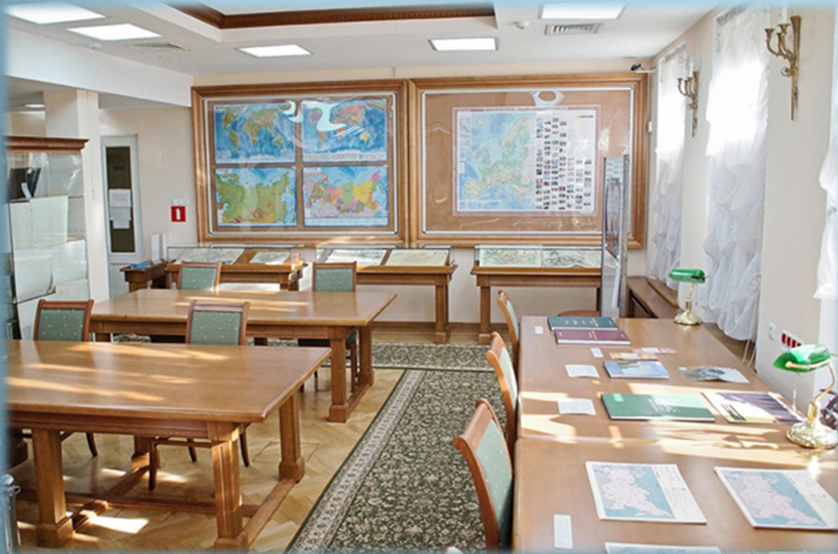
Читальный зал отдела картографических изданий