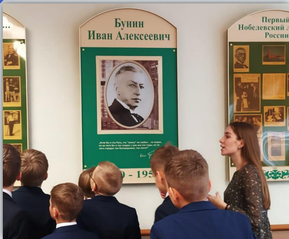
Музей И.А. Бунина