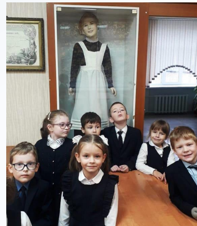
Музей истории гимназии